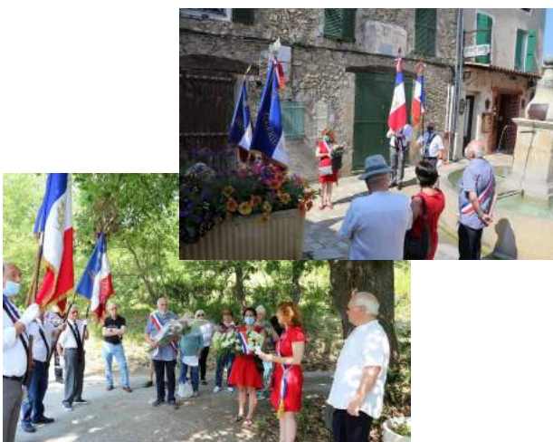
Commémoration du 16 juin