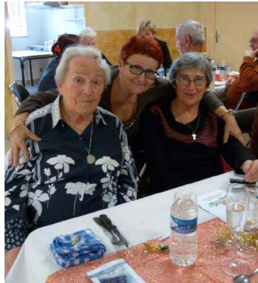
Repas de Noël

Nous organisons des jeux et une fois par mois, nous nous retrouvons autour d'un repas musical ou d'une sortie. Ces rencontres sont ouvertes à tout âge. L'adhésion annuelle est de 15€ qui vous permet de participer à nos activités diverses et d'avoir de nombreuses remises dans différents commerces à Manosque et autres.