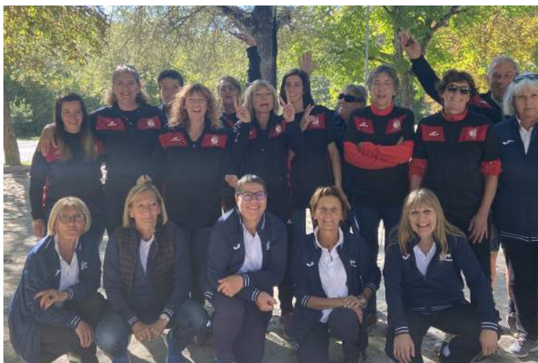
Les équipes féminines de gap et St Martin

La grosse boule regroupe 18 licenciés. La dernière saison a largement été perturbée par le COVID.