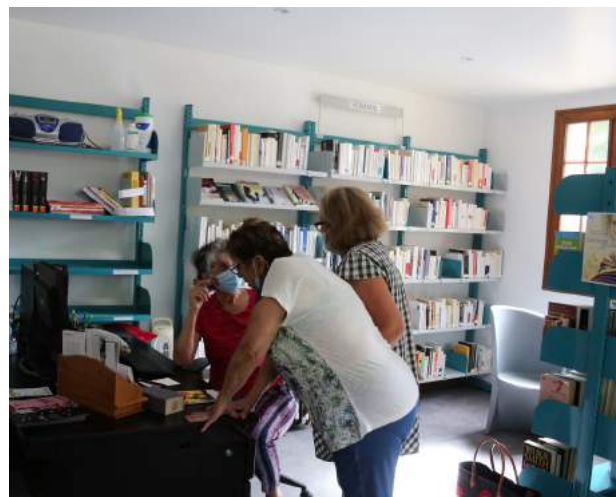
Les bénévoles de la bibliothèque au travail

La restauration des cloches de l'église est en cours. Les jougs menaçaient de lâcher et un bon nettoyage s'impose. Les dossiers sont déposés.