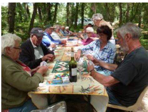
Traditionnel pique nique des Amis du Colostre

Cette année, nos activités ont été malmenées par la présence du Covid. Nous comptons sur votre présence lors de l'Assemblée Générale le 25 janvier 2022 à 10h30 dans la salle polyvalente. Elle sera suivie d'un apéritif convivial pour se retrouver enfin tous ensemble. Le passe sanitaire sera obligatoire.