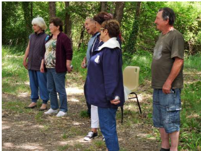
Parties de pétanque au stade des Amis du Colostre