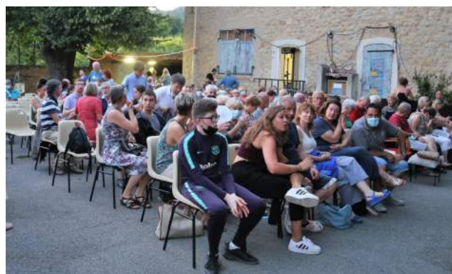
Cour de l'ancienne école pour les coups de cœur juillet 2021

Et bien sûr : Le 24 décembre 2021 notre traditionnelle Pastorale