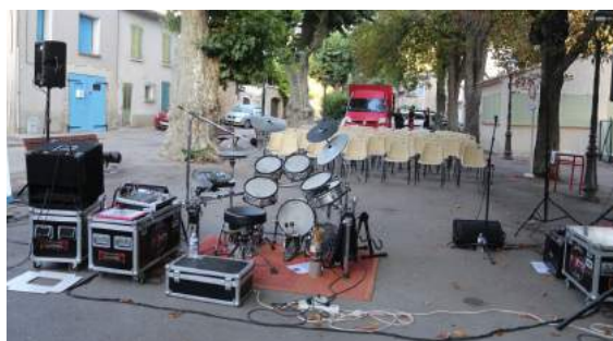
Concert estival de DLVAgglo