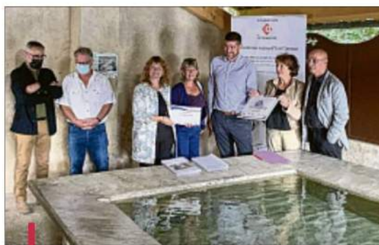
Le nouveau lavoir.