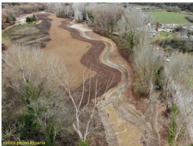
Le Colostre, 2021