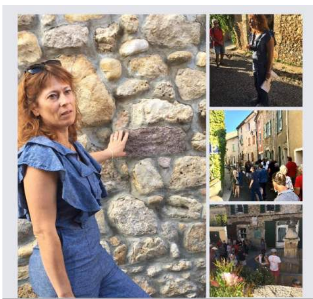
Visite guidée du village en septembre 2021

Cette visite guidée remporte toujours un vif succès, par cette belle journée de septembre moments partagés de plaisir de la découverte et de faire découvrir Saint-Martin-de-Brômes.